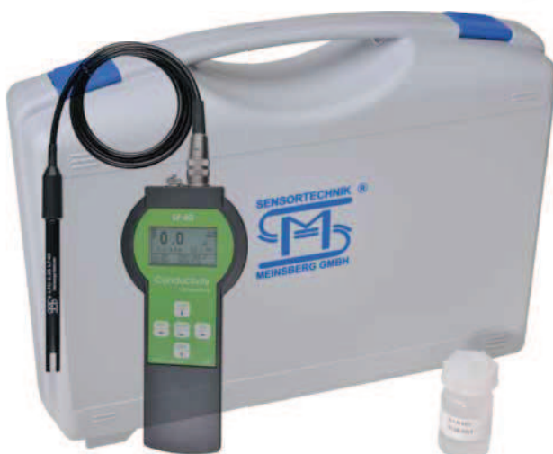
LF 40/Set mit Leitfähigkeitssensor LTC 0,35/LF 40 LF 40/Set with Conductivity Sensor LTC 0,35/LF 40