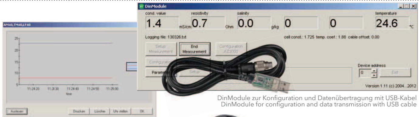
DinModule zur Konfiguration und Datenübertragung mit USB-Kabel DinModule for configuration and data transmission with USB cable