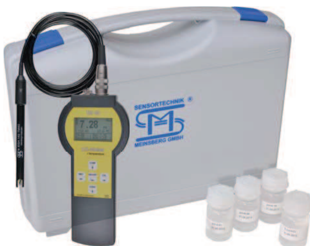
TM 40/Set mit pH-Sensor EGA 142/TM 40 TM 40/Set with pH Sensor EGA 142/TM 40