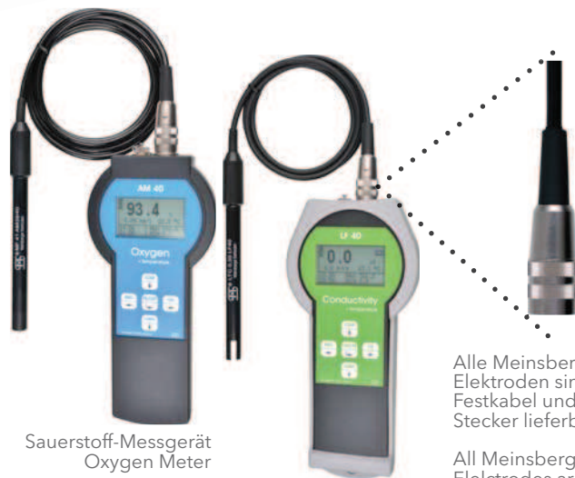
Sauerstoff-Messgerät Oxygen Meter