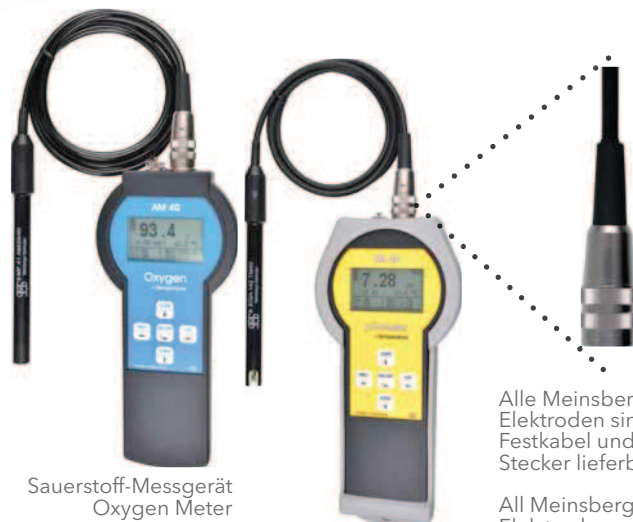
Sauerstoff-Messgerät Oxygen Meter